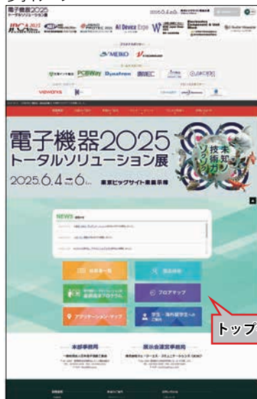
トップページ PR動画掲載 (イメージ)