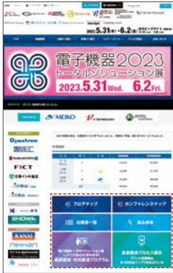
トップページ PR動画掲載 (イメージ)