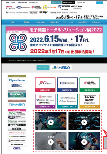
トップページ PR動画掲載 (イメージ)