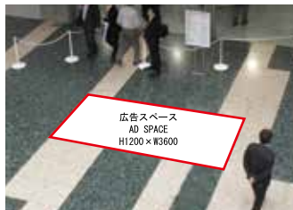
広告スペース AD SPACE H1200×W3600