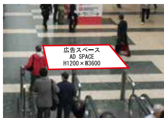
広告スペース AD SPACE H1200×W3600