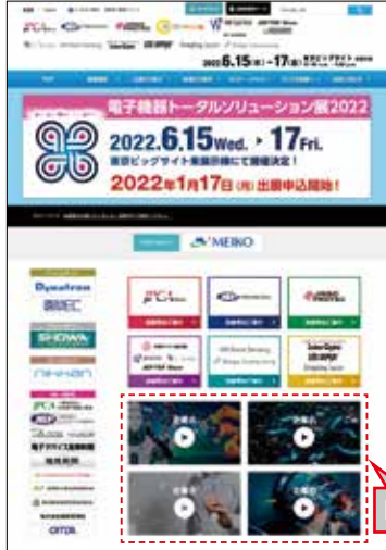
トップページ PR動画掲載 (イメージ)