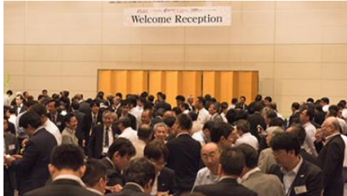
*レセプション会場の様子