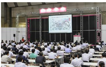
*基調講演会場の様子