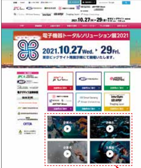
トップページ PR動画掲載

公式サイトトップページに自社 PR 動画を掲載いたします。 新製品紹介、製品デモ、自社ブランディング動画など、様々な動画が掲載可能です。